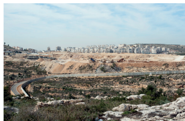
La colonie de Modi'in Illit est construite sur les anciens champs d'oliviers de Bil'in.

Les manifestations mêlent villageois palestiniens, militants israéliens et internationaux qui cheminent jusqu'au mur derrière lequel les soldats, calfeutrés, attendent de tirer leurs grenades lacrymogènes. De l'autre côté du mur s'étendent à perte de vue les nouveaux logements. À Bil'in aussi le tracé du mur est basé sur les seuls intérêts israéliens, sans aucune considération pour les habitants et en violation de leurs droits. Le mur aboutit à l'annexion de facto des terres situées du côté de la colonie.