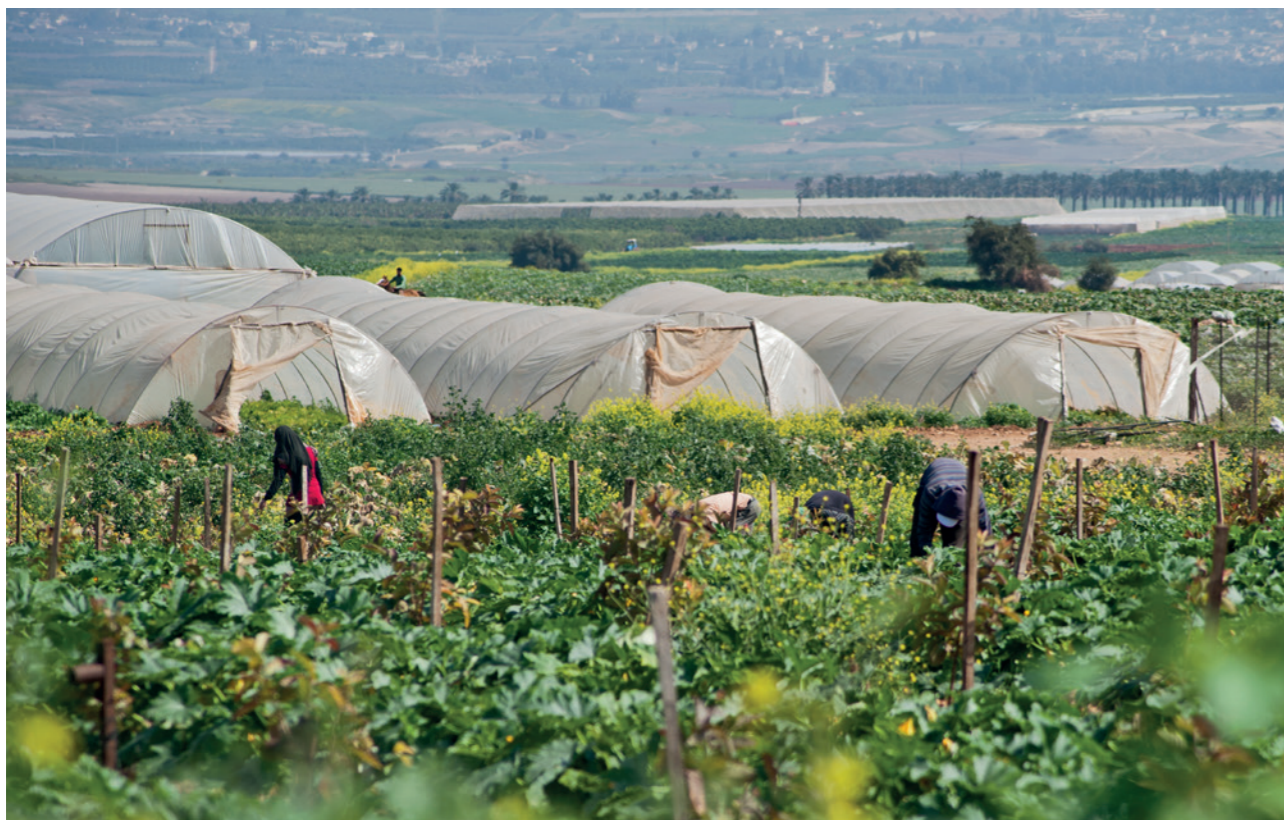
Cultures palestiniennes dans la vallée du Jourdain.

des puits palestiniens peu profonds. Depuis 1967, aucun nouveau puits n'a été construit. Les demandes faites par les habitants de la vallée du Jourdain ont été systématiquement refusées par la Commission mixte (israélo-palestinienne) de l'eau en charge de l'approbation des projets de développement des infrastructures et des ressources d'eau en Cisjordanie, au sein de laquelle Israël bénéficie du droit de veto. Toute réparation sur un puits existant est également soumise à autorisation israélienne, accordée à de rares occasions. Les Palestiniens ne sont pas autorisés à recueillir l'eau de pluie dans des bassins, l'armée israélienne détruit systématiquement ce type d'infrastructures. Pour vivre, élever du bétail et cultiver une part toujours plus réduite de terre, les Palestiniens de la vallée dépendent de quotas qui n'ont pas changé depuis 1967. Ils n'ont d'autre alternative que de stocker dans des citernes l'eau achetée au prix fort à la société israélienne Mekorot. La quantité d'eau ainsi obtenue, délivrée par à coup et de manière irrégulière, ne leur permet pas de cultiver la totalité de leur terre et de générer suffisamment de revenus pour vivre. Ils courent alors le risque de se voir confisquer le peu de terre qu'il leur reste au motif de la loi ottomane déjà citée (une terre non travaillée pendant trois ans est confisquée par l'État qui en devient le propriétaire).