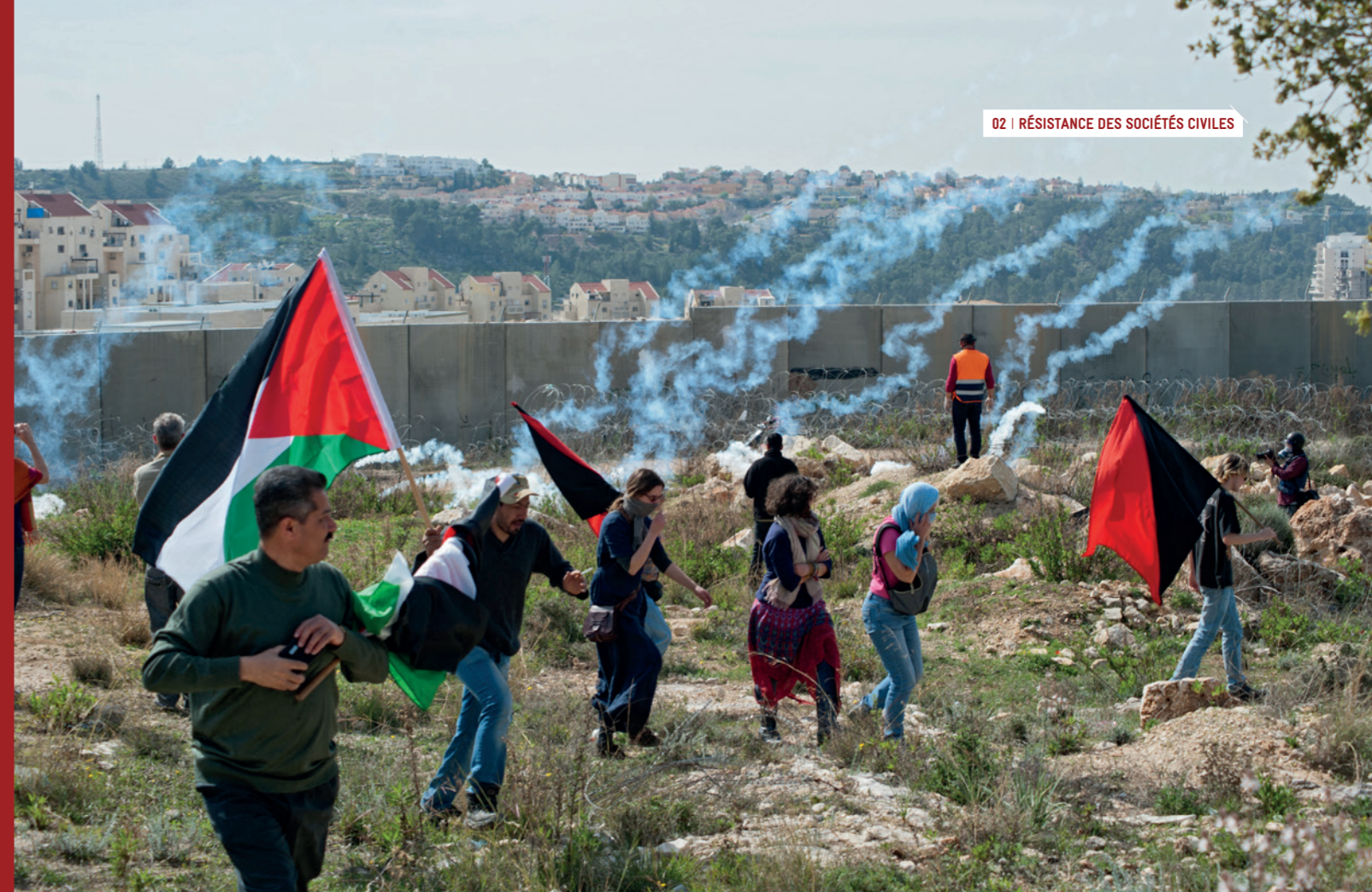
Bil'in, manifestation devant le mur d'annexion.

Dans cet océan d'injustices, il ne s'agit pour le moment que de l'émergence « d'îlots de résistance ». Mais ces petites îles palestiniennes et israéliennes sont le signe visible de l'existence d'une terre ferme où résident des forces porteuses d'espoir pour l'avenir.