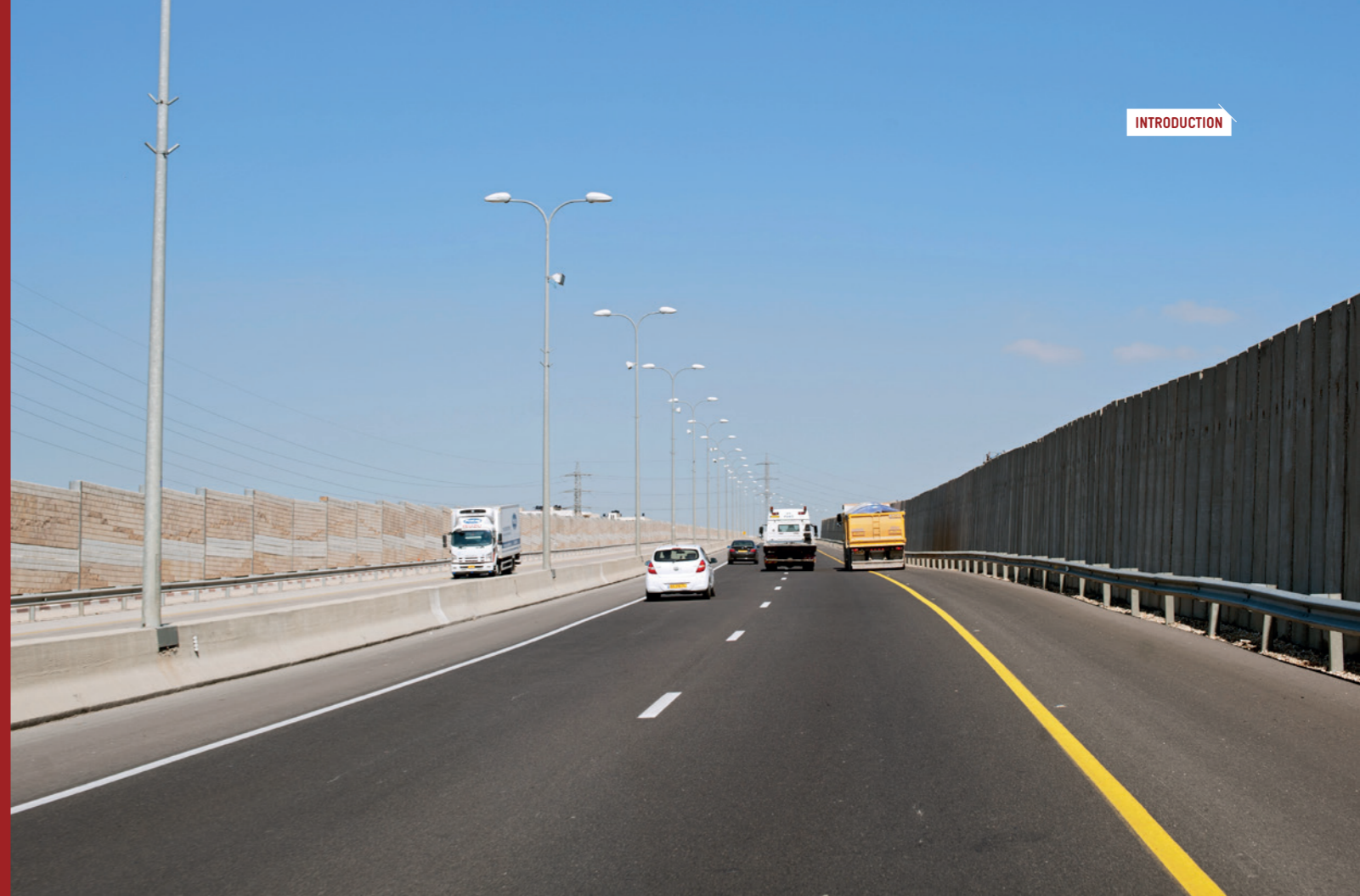
La route 443 relie Jérusalem à Tel Aviv. Juste derrière les murs, les villes palestiniennes de Bir Nabala et de Qalandiya, pour lesquelles il n'existe aucun accès.

La référence au processus de paix est le cadre obligé de tous les discours depuis des décennies. Dans les enceintes internationales comme dans tous les processus de négociations engagés sous l'égide des administrations américaines qui se sont succédées depuis les accords d'Oslo de 1993, l'objectif d'arriver à une « paix juste et durable » entre Israéliens et Palestiniens n'a cessé d'être le leitmotiv officiel.