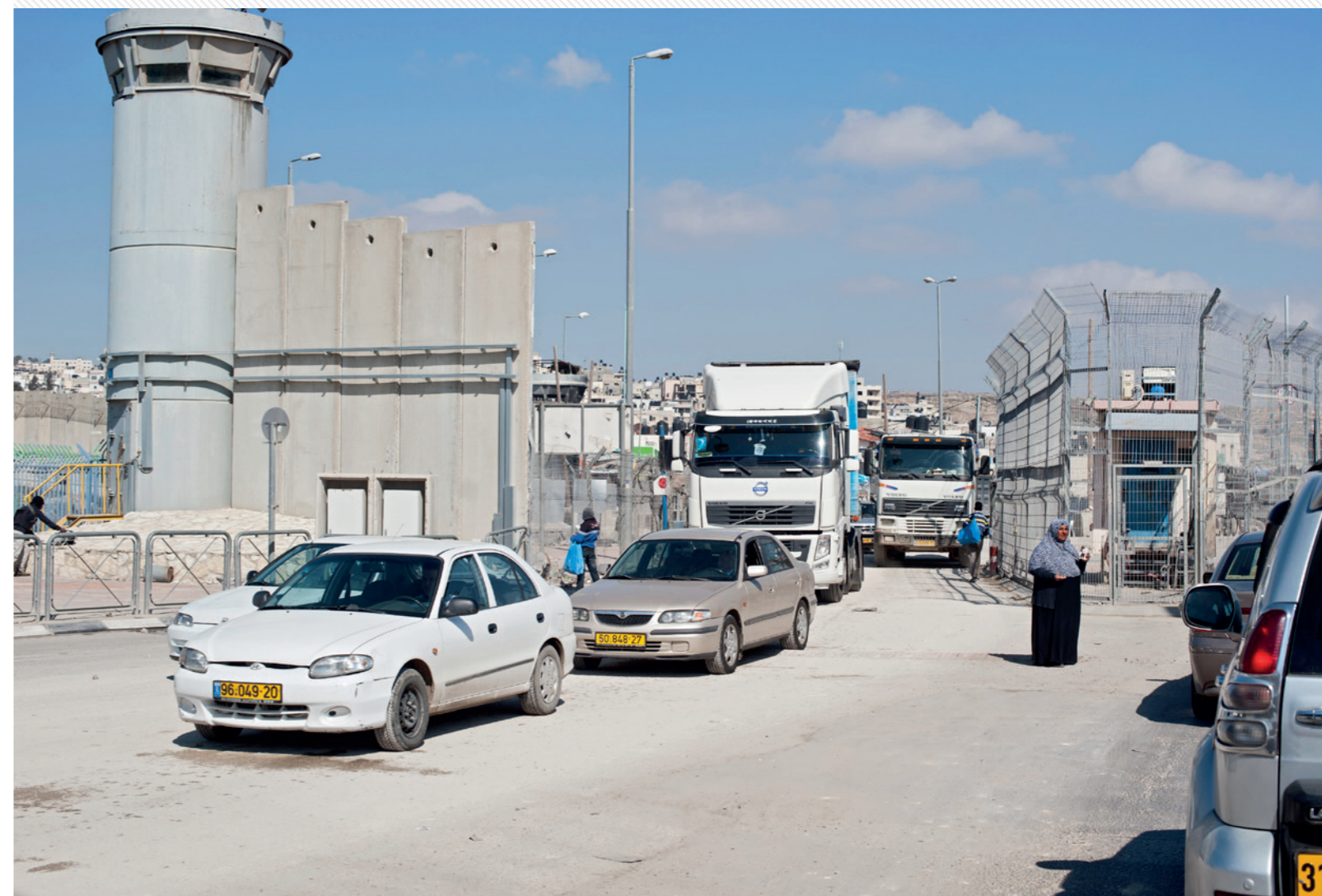
Check Point de Qalandiya à proximité de Ramallah.

Association de sensibilisation à l'histoire et aux conséquences de la Naqba – Tel Aviv