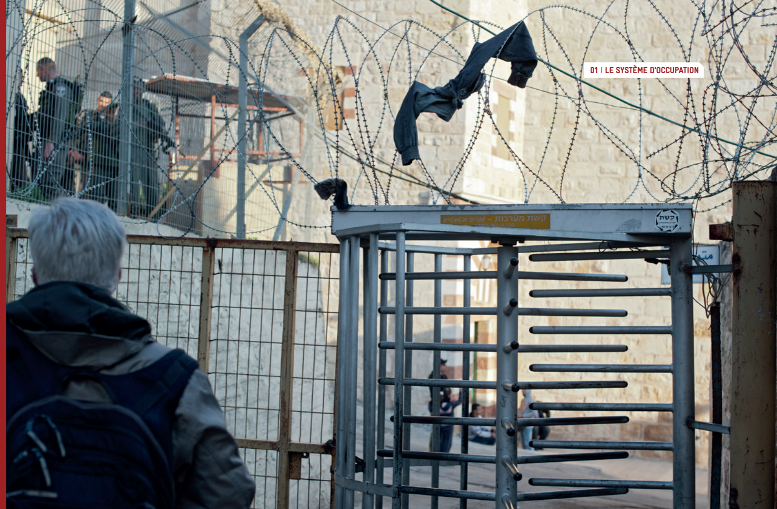
Hébron, check-point à l'entrée du mausolée des Patriarches

À y regarder de plus près, l'occupation israélienne dans les territoires palestiniens apparaît bien comme un système implacable aux multiples enjeux. S'il s'agit bien de coloniser et d'annexer le plus de territoires possibles, cela s'opère par différents moyens, depuis les colonies « légalisées » par les différents gouvernements jusqu'aux avant-postes sauvages plus ou moins tolérés, en passant par l'annexion pure et simple opérée par le mur de séparation. Il s'agit aussi de rendre la vie impossible aux Palestiniens par toutes sortes de moyens, dans le but évident de les empêcher de s'organiser, de les décourager au point de pousser au départ ceux qui n'ont pas été chassés, comme à Hébron ou dans la vallée du Jourdain. On relève ainsi un empilement de moyens, de contraintes et de restrictions de toutes sortes, codifiés par des milliers de décrets civils ou militaires et combinés à une répression féroce et continue.