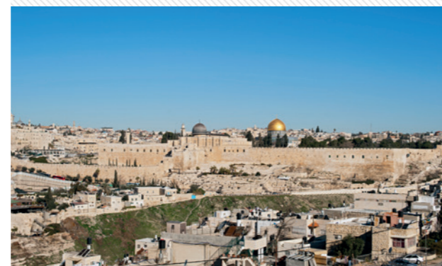
À Jérusalem, le quartier Silwan commence en bas à droite de la photographie.

Le quartier de Silwan, situé au pied de la mosquée Al Aqsa et du Mont du Temple, connaît de fortes tensions depuis plusieurs années. L'État d'Israël entend construire en lieu et place de ce quartier palestinien un complexe archéologique, le « Parc national de la cité de David ». Le gouvernement israélien a confié ce projet « archéologique » à Elad, une organisation de colons d'extrême droite particulièrement violente. Dès 1990, Elad a commencé à prendre possession des terres et des maisons des habitants palestiniens expropriés sous couvert de l'APA (Absent Property Act) et gérées par le JNF (Fond National Juif). Expropriations, fabrication de faux certificats de propriété, extorsions de signature de personnes âgées, violence contre les enfants, fermeture des espaces publics au motif de fouilles archéologiques, celles-ci conduites de manière accélérée entraînant l'effondrement d'immeubles d'habitation et d'écoles ; par tous ces moyens Elad tente de chasser les Palestiniens pour leur substituer des colons juifs. D'après la Coalition Civile pour les Droits des Palestiniens de Jérusalem, plus de 400 colons occupent actuellement 54 implantations dans le quartier.