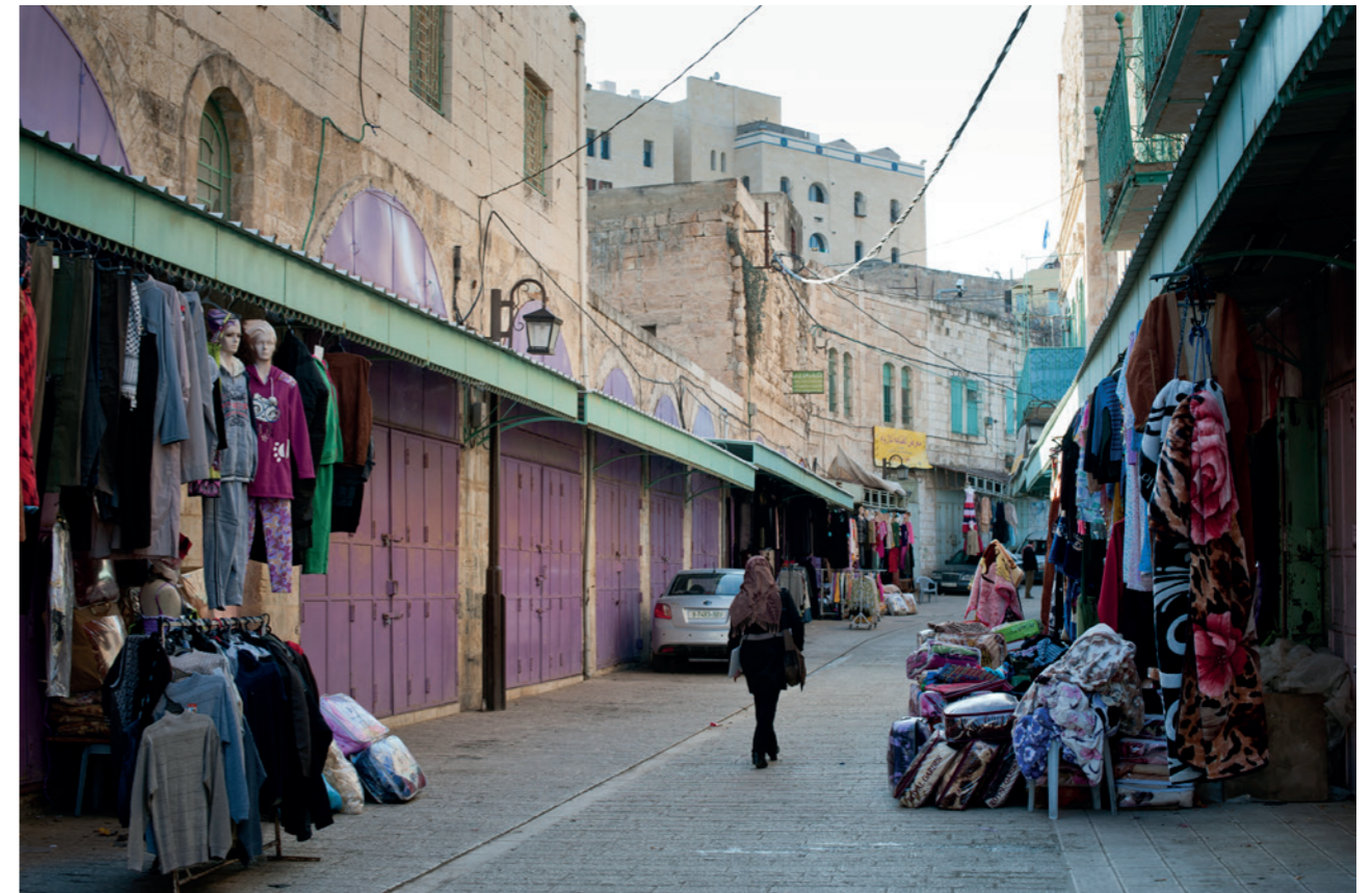
Au cœur de la vieille ville d'Hébron. Au fond, la nouvelle Yeshiva construite par les colons.