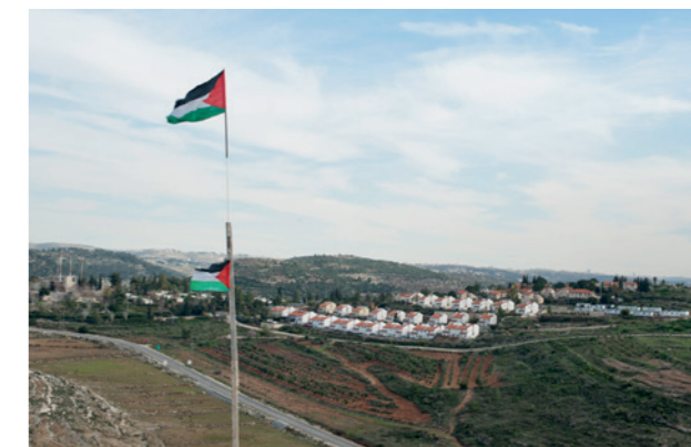
La colonie de Haramish occupe la majeure partie des terres agricoles d'Al-Nabi Saleh.

Sans protection face à la violence des colons et en l'absence d'application des décisions de justice qui leur