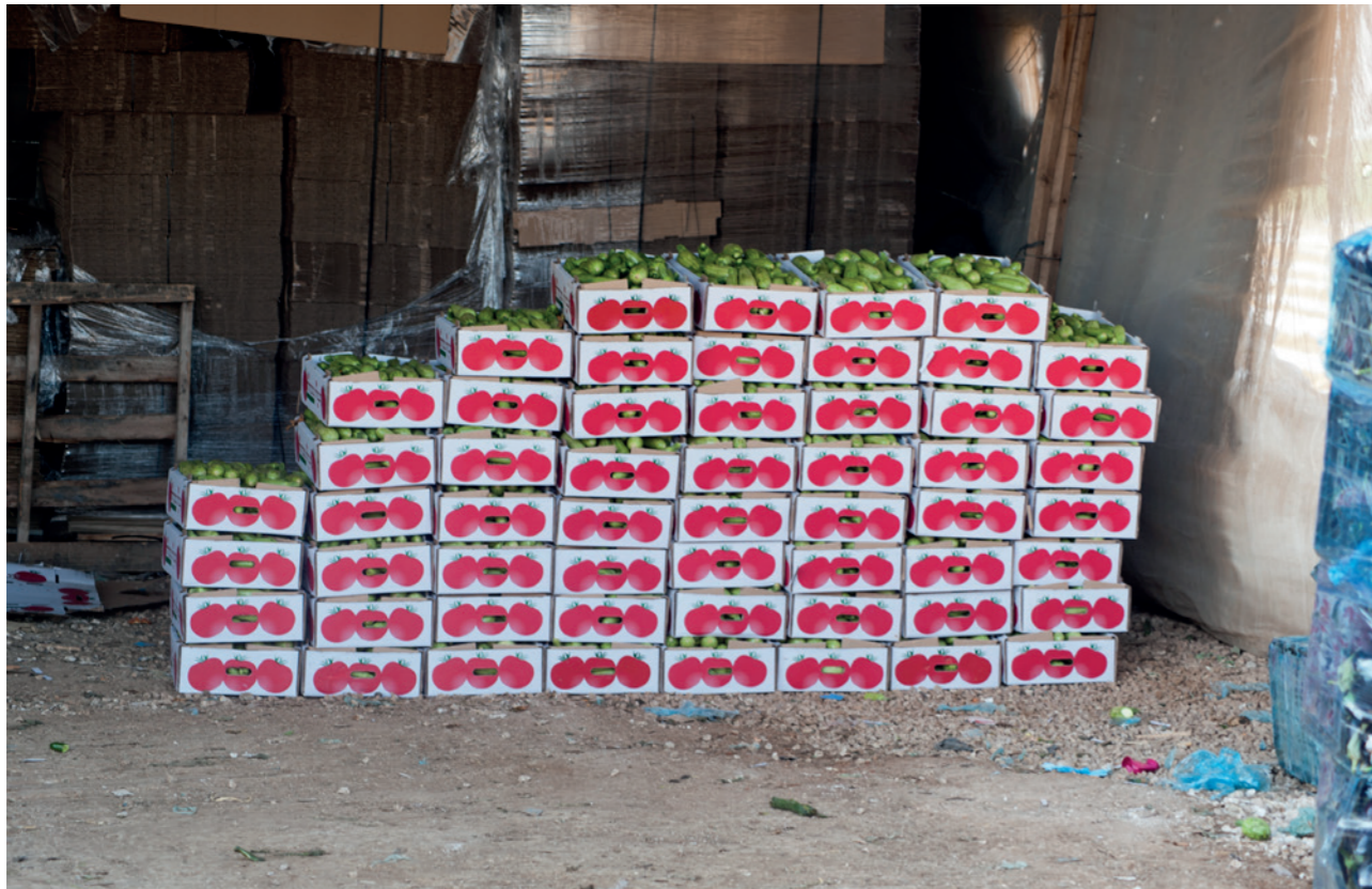
Courgettes produites par une coopérative palestinienne dans la vallée du Jourdain, qui rencontre beaucoup d'obstacles à leur exportation.

l'apartheid. Nous faisons appel à vous pour faire pression sur vos États respectifs afin qu'ils appliquent des embargos et des sanctions contre Israël. Nous invitons également les Israéliens honnêtes à soutenir cet appel, dans l'intérêt de la justice et d'une véritable paix. »