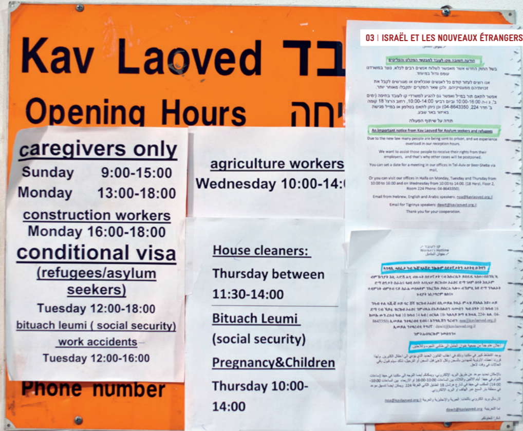
Panneau d'information à l'entrée de l'association Kav Laoved, Tel Aviv.

Pour ce pays d'immigration de Juifs du monde entier, la question du statut et des conditions d'accueil de populations non juives et non palestiniennes est lourde de signification à de multiples égards. L'arrivée récente d'exilés africains en quête d'asile et l'appel à des milliers de travailleurs migrants venus d'Asie pour se substituer aux travailleurs palestiniens, pose à l'État israélien des questions nouvelles et fondamentales qui touchent à son identité et à son besoin de main d'œuvre à bon marché. Malheureusement, les réponses données jusqu'à présent semblent avant tout dictées par la politique ethno-nationaliste et colonialiste qui domine depuis quelques années, au mépris des lois nationales que l'État d'Israël respecte pour ses citoyens juifs et des conventions internationales auxquelles il a souscrit. Le constat, dénoncé par les organisations israéliennes de défense des droits, est que la politique menée pour les demandeurs d'asile et les travailleurs étrangers porte atteinte aux droits humains fondamentaux des étrangers, et contrevient aux obligations internationales de l'État d'Israël.