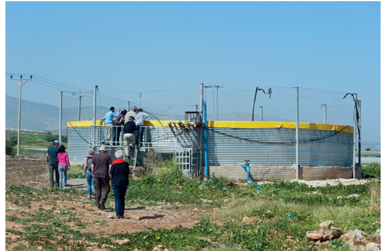
Réservoir d'eau dans la vallée du Jourdain.

Entre absence de droits, violence de l'armée, augmentation des agressions commises par les colons 4 bénéficiant d'une totale impunité, projet d'annexion 5 et passivité de l'Autorité palestinienne, le futur des paysans et des Bédouins palestiniens de la vallée du Jourdain paraît sombre. Pour autant leur capacité dans l'adversité de continuer à prendre soin de leurs terres et de leurs troupeaux, leur volonté de continuer