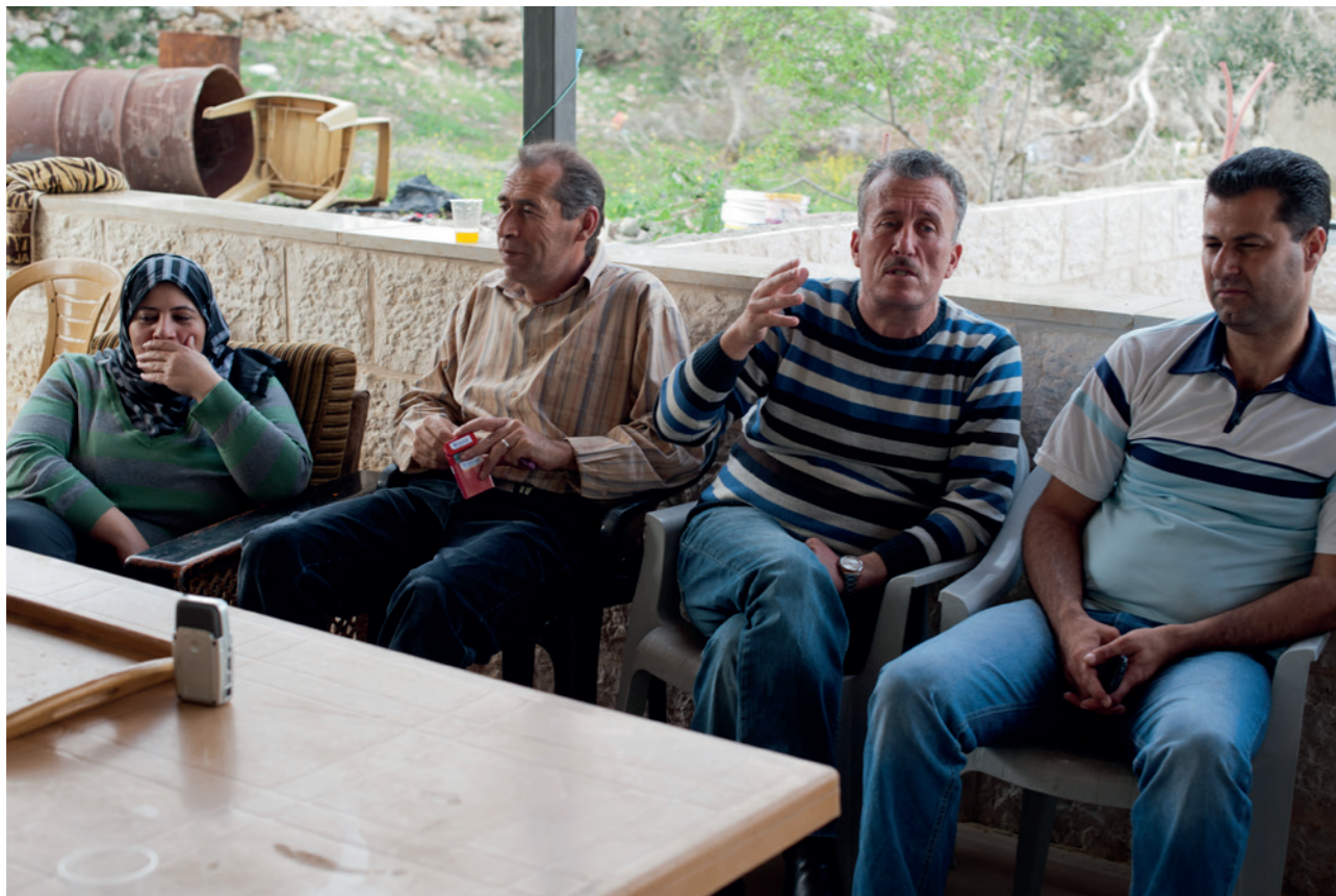
Les responsables des comités populaires de résistance d'Al-Nabi Saleh et de Bil'in.

protection tout en suscitant l'ire des Israéliens, doit être alimentée pour durer. Pourtant, années après années, la mobilisation s'essouffle. Difficile de trouver des idées originales d'action semaine après semaine ; de faire face au risque d'arrestation, et aux violences lors des manifestations ; de continuer à lutter alors que la construction des colonies ne cesse pas, inscrivant dans la terre une annexion rendue de fait irréversible. Derrière l'énergie d'hommes et de femmes qui sacrifient leur vie à cette cause, point la fatigue extrême d'une génération de combattants pour la paix poussés à bout par l'absence de perspective.