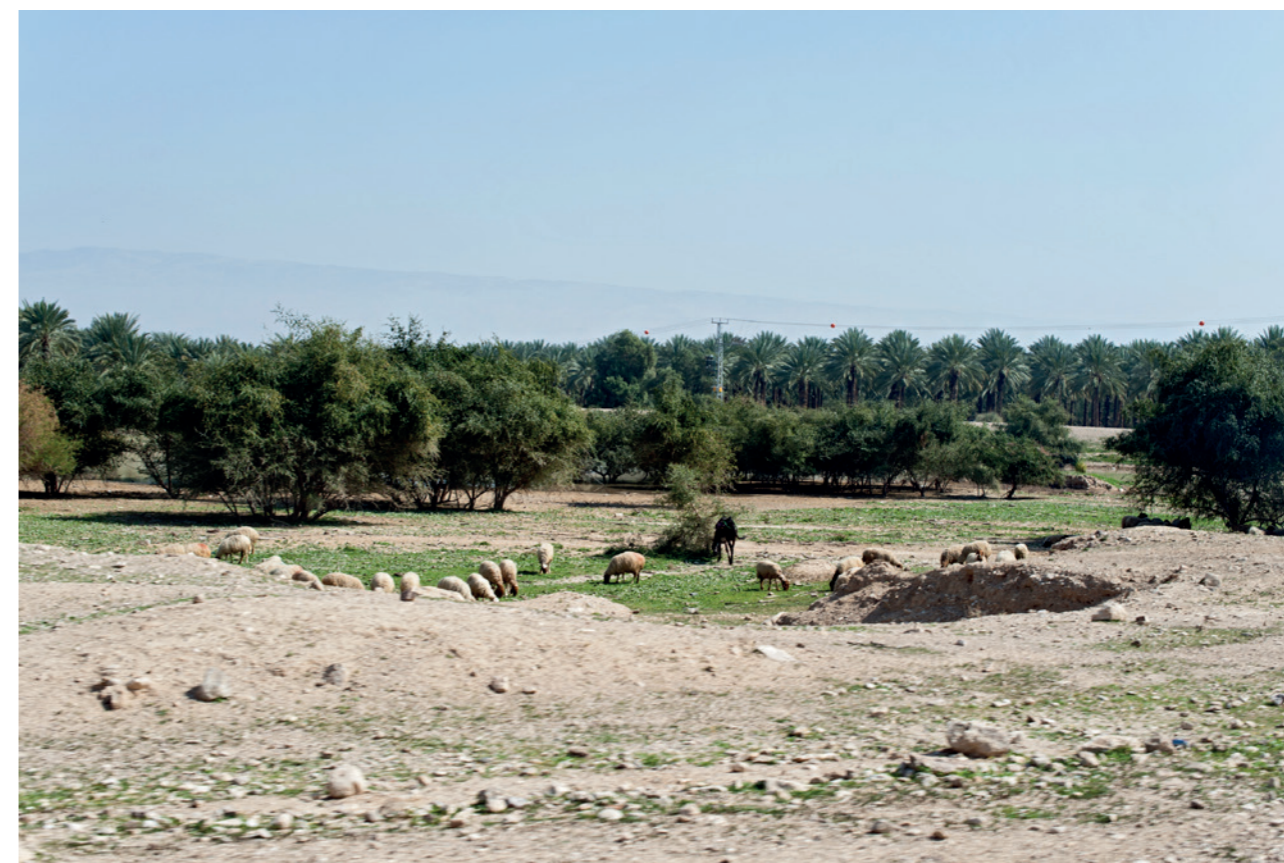
Moutons de Bédouins dans la vallée du Jourdain. Au fond, la palmeraie d'une exploitation coloniale israélienne.

Alors que depuis 2007, le droit du travail fixe le salaire minimum à 150 shekels (31 €), les ouvriers palestiniens des colonies ne touchent en moyenne que 60 shekels (12 €). La plupart des ouvriers travaillent sans aucune forme