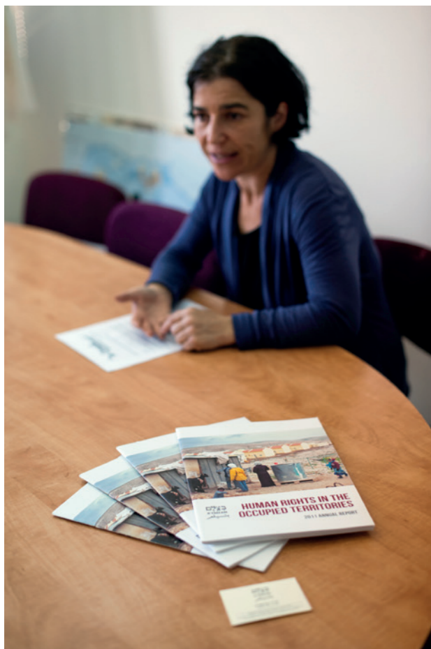
B'Tselem, centre israélien d'information pour les droits de l'homme dans les territoires occupés.

À cette atteinte au droit de vivre sur leur terre, s'ajoutent bien d'autres formes de discriminations entre les Palestiniens et les colons. Les exemples les plus scandaleux concernent l'accès à la ressource vitale de l'eau, illimitée dans les colonies mais réduite au minimum pour les Palestiniens, ainsi que le fonctionnement de la justice. Les habitants des territoires palestiniens sont placés sous contrôle militaire israélien dans la majeure partie de la Cisjordanie. Ils sont soumis à un régime de justice militaire, alors que leurs voisins des colonies sont régis par la justice civile. Si un conflit éclate entre un Palestinien et un colon (même s'il s'agit de mineurs), pour le même fait, le premier passera devant un tribunal militaire et le second devant un tribunal civil, avec des résultats différents comme on peut le constater au vu du nombre de Palestiniens placés en détention au moindre prétexte.