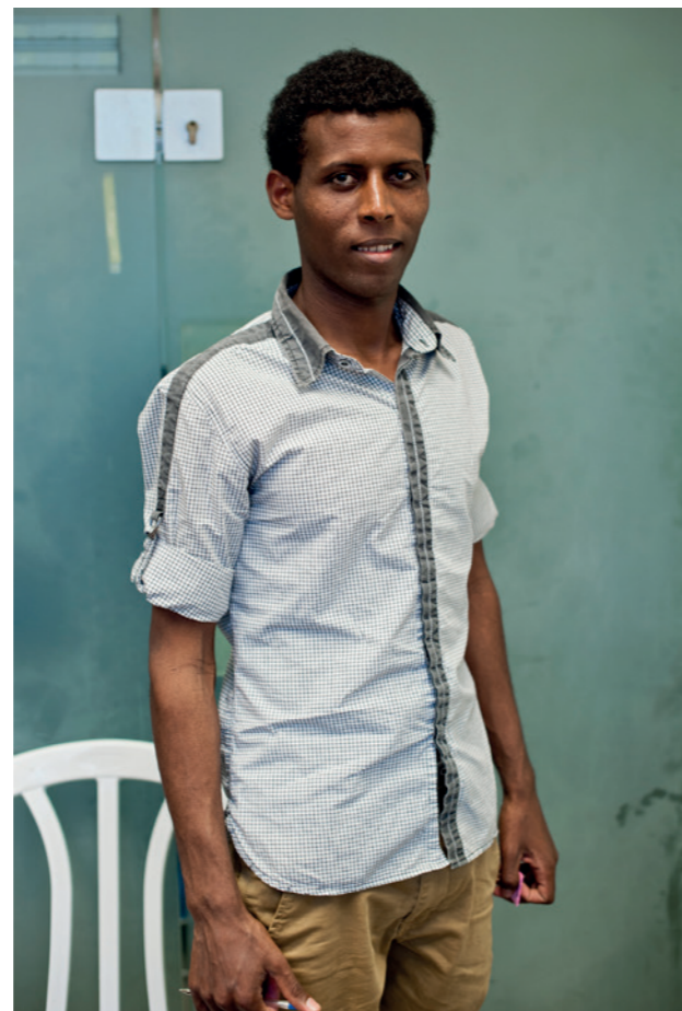
Ce jeune réfugié érythréen est devenu traducteur bénévole à Kav Laoved.

Les demandeurs d'asile entrés avant janvier 2012, se sont vus accorder un « visa de liberté conditionnelle », renouvelable tous les trois mois, ne donnant pas droit au travail, qui n'est autre qu'une autorisation provisoire de séjour en attente d'expulsion. Depuis quelques mois, les possibilités de renouvellement de ces visas ont été volontairement réduites (moins de lieux disponibles, réduction des plages horaires), ce