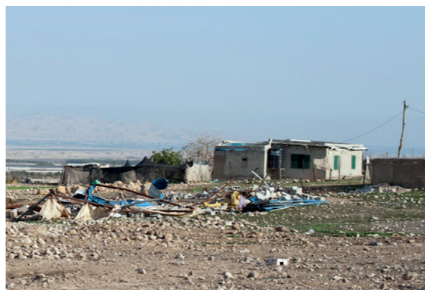
Maison bédouine détruite pour la énième fois, village de Fasayel, vallée du Jourdain.